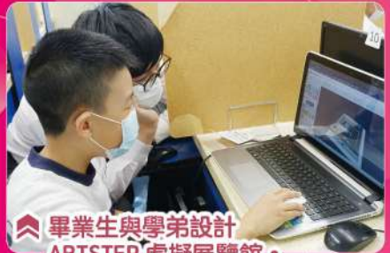
▲畢業生與學弟設計 ARTSTEP 虛擬展覽館。