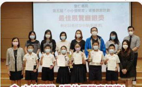
▲本校榮獲「最佳展覽廳銀獎」。