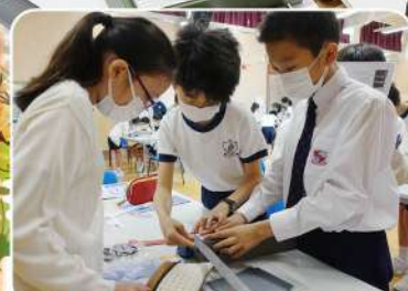
P.5 同學仔細地量度車身的長度，他們的設計必須盡量減低車身的重量。