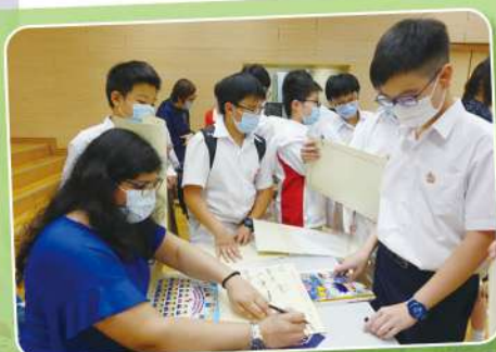
回到母校 同學紛紛向老師索取簽名