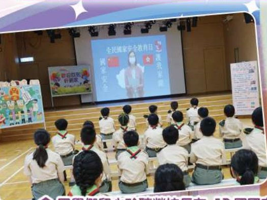
同學們留心聆聽勞校長在「全國國家安全教育日」當天的講話