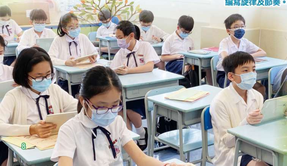
同學向全班發佈自己的作品。