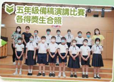
五年級備稿演講比賽 各得獎生合照

各班小五和小六的學生須按指定題目預備演講稿，演說時能展現「軒銅人」應具備的良好素質：「感恩珍惜 自律自學」。學生在欣賞同學演講之餘，可以取長補短，提升說話能力。