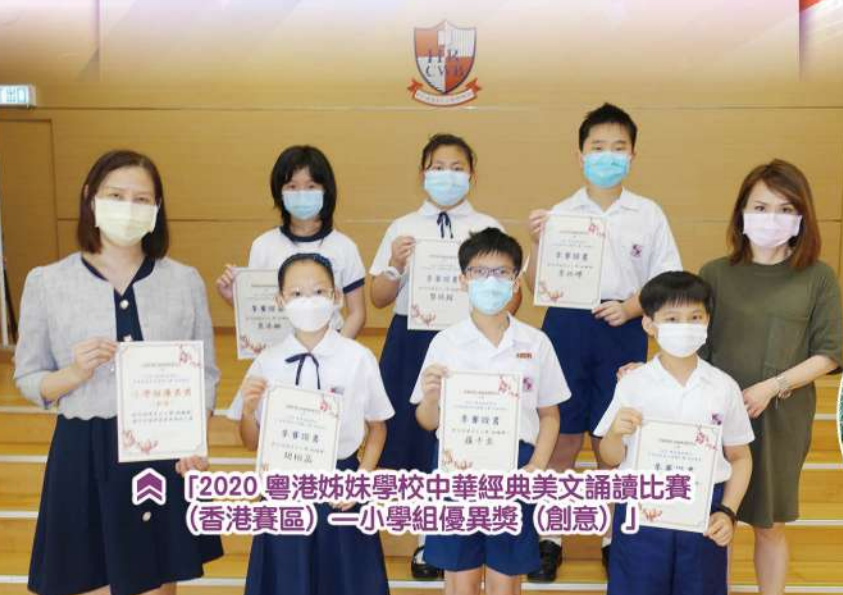
「2020 粵港姊妹學校中華經典美文誦讀比賽（香港賽區）」小學組優異獎（創意）」