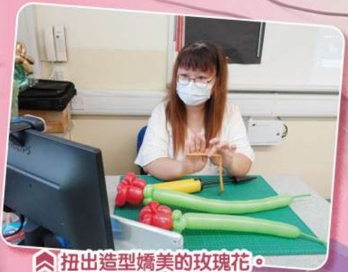
扭出造型嬌美的玫瑰花。