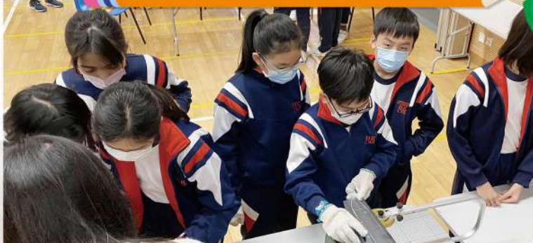
P.6 同學使用切割機製作火箭車身。