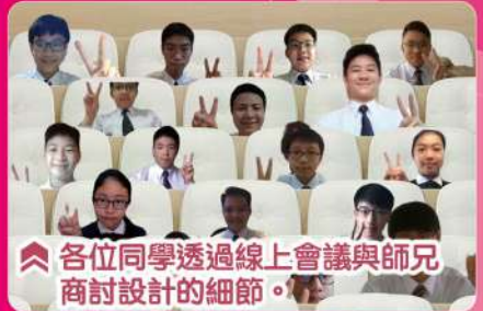
▲各位同學透過線上會議與師兄商討設計的細節。