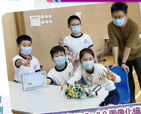
同學學習編寫 WeDo 2.0 圖像化編程軟件。