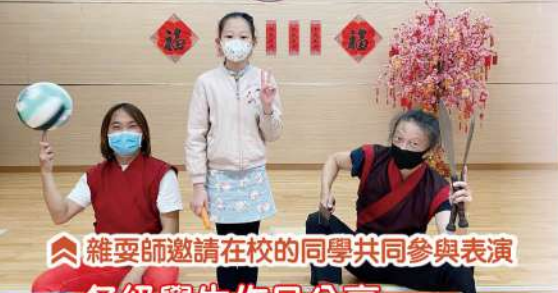
雜耍師邀請在校的同學共同參與表演 各級學生作品分享