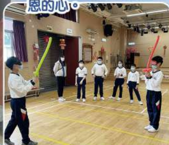
同學們互相合作下完成挑戰任務。