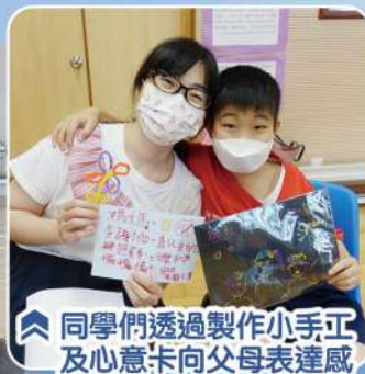
同學們透過製作小手工及心意卡向父母表達感恩的心。