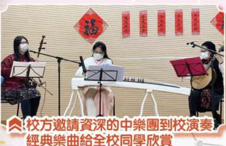
校方邀請資深的中樂團到校演奏 經典樂曲給全校同學欣賞