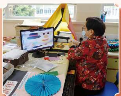
導師教授同學製作不同的手工藝品