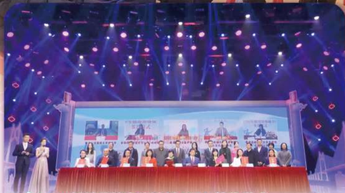
2020 姊妹學校交流計劃「雲」簽約儀式

本年度，本校學生與內地姊妹學校—廣州市越秀區東風東路小學同學以書信作交流，書信主題圍繞「讀書心得」、「在家弄有『營』的一餐」、「過去一年所學到的新知識或技能」及「特別的學習天」。同時，六名五年級學生代表與內地學生首次合作，參加了「2020 粵港姊妹學校中華經典美文誦讀比賽（香港賽區）」，誦材題目是關登瀛的《新的一年帶來新的希望》。很高興，我們於是次比賽榮獲「小學組優異獎（創意）」，兩校同學皆雀躍萬分，盼明年一起參與比賽，再締造不平凡的學習經歷。