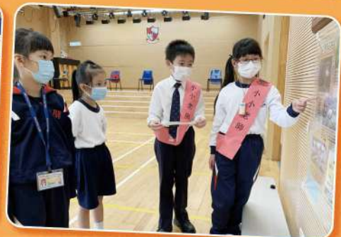
小小老師指導小一生，讓他們盡快適應小學生活。