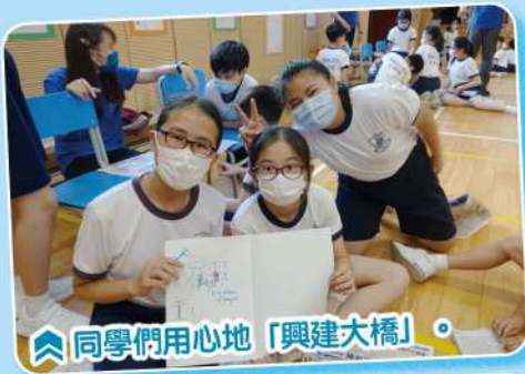
同學們用心地「興建大橋」。