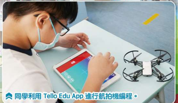
同學利用 Tello Edu App 進行航拍機編程。