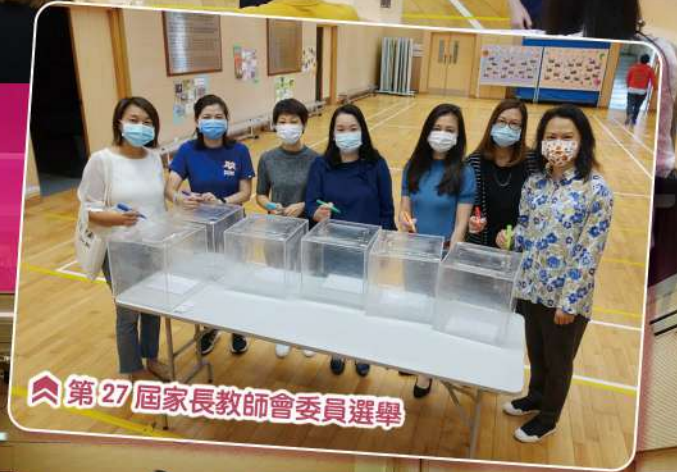
第27屆家長教師會委員選舉