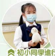
初小同學進行 個人短講情況。