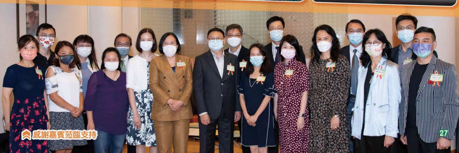
感謝嘉賓蒞臨支持