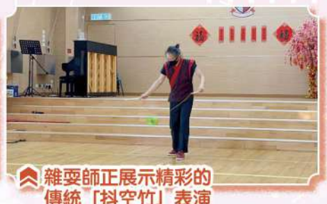
雜耍師正展示精彩的 傳統「抖空竹」表演