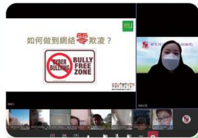
不做欺凌者和被欺凌者。

三、四年級學生在 4 月 23 日參加由香港遊樂場協會舉辦的網絡健康及網上學習支援計劃——「網絡健康講座」。