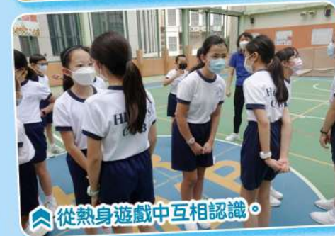
從熱身遊戲中互相認識。

當天，圖書館領袖生分為三隊，訓練同學團隊合作、決策和解難能力。富趣味活動包括：「數豆任務」及「興建大橋」，有效提升圖書館領袖生的溝通協作能力，讓他們學習如何達成共識。