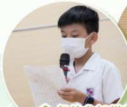
各位參加備稿演講比賽 的同學就算面對眾多同 學，表現也十分淡定。