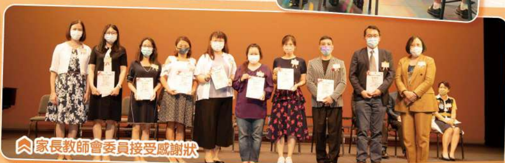
🏠 家長教師會委員接受感謝狀