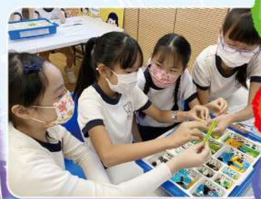
P.4 同學先檢查及了解 LEGO 各組件的功用。