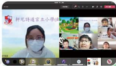
學生有着軒銅人的質素，齊來學健康上網。

我們在 2020 年 12 月 4 日邀請香港家庭福利會社工為五、六年級學生舉辦資訊素養專題講座——「健康網『樂』學生講座」。