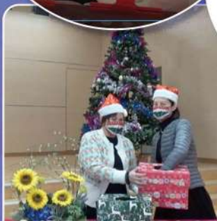
誰是下一位幸運兒？