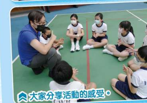
大家分享活動的感受。