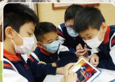
P.5 同學正在使用 Wind Tunnel 軟件設計車身。