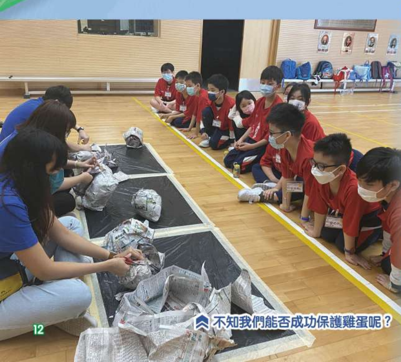
不知我們能否成功保護雞蛋呢？

成長的天空計劃的目標是照顧高小學生的成長需要，協助他們掌握生活技能，灌輸正確的價值觀，培養積極樂觀的態度，以及增強師生、家校、朋輩的正面連繫，從而提升學生的抗逆力。