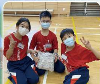
終於完成保護雞蛋裝置，Yeah!