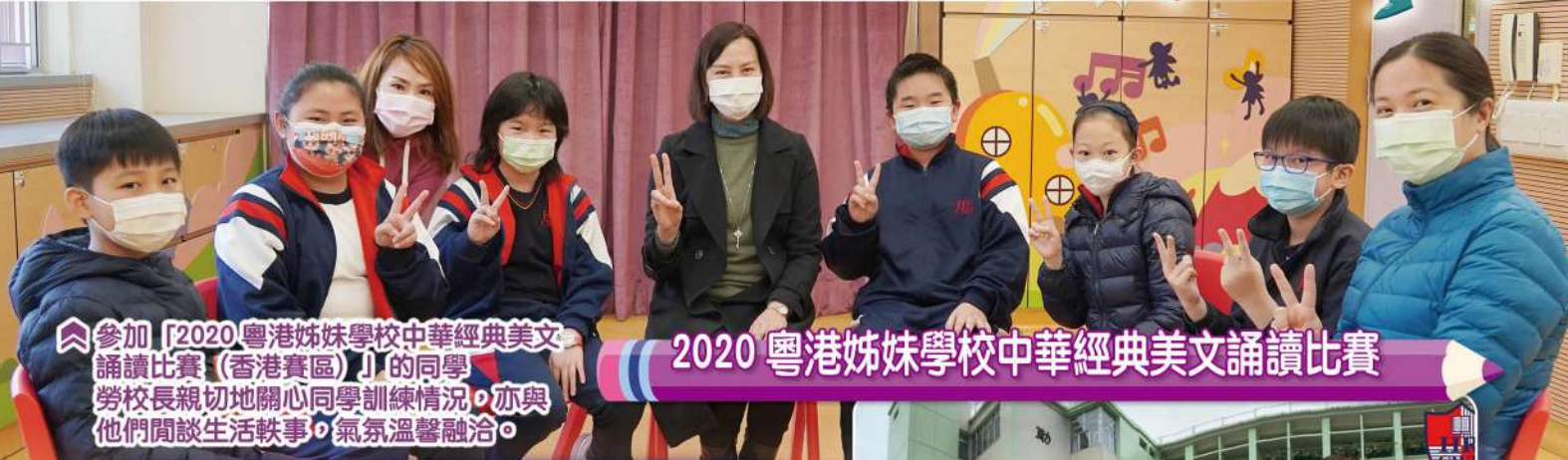
參加「2020 粵港姊妹學校中華經典美文誦讀比賽（香港賽區）」的同學，勞校長親切地關心同學訓練情況，亦與他們閒談生活軼事，氣氛溫馨融洽。