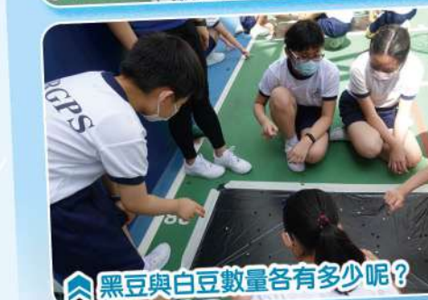
黑豆與白豆數量各有多少呢？