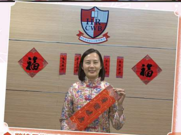
勞校長當天在網上向全校師生送上祝福賀詞

本校於二月九日舉辦了網上中華文化日，當天的節目內容豐富，同學除了在家中透過網課與家人一起參與製作富有中國文化特色的手工藝品外，還可以欣賞傳統的中樂演奏及精彩的雜耍表演。活動加深同學對中華文化的認識。