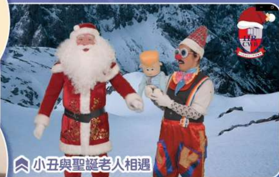
小丑與聖誕老人相遇