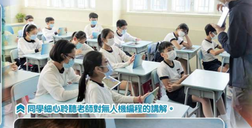
同學細心聆聽老師對無人機編程的講解。