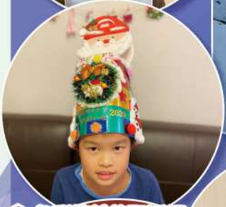
色彩繽紛的聖誕帽