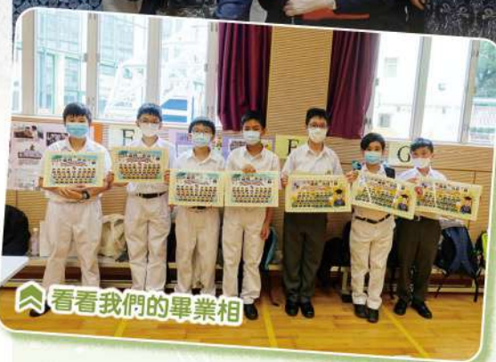
看看我們的畢業相

舊生會於二零二零年十月二十七日，為去年的畢業生舉行了舊生重聚日，當天已畢業的同學重回母校與同學及老師聚首一堂，氣氛熱鬧，場面溫馨。