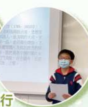
高小同學進行 個人短講情況。