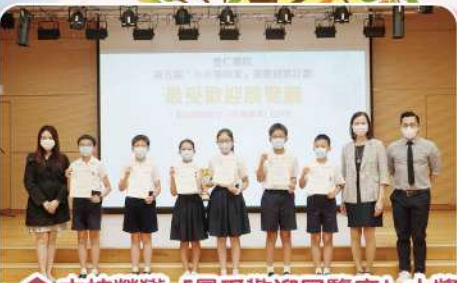
▲本校榮獲「最受歡迎展覽廳」大獎。