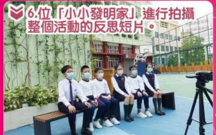
▲6位「小小發明家」進行拍攝整個活動的反思短片。