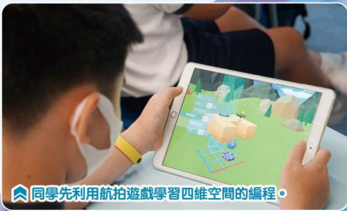
同學先利用航拍遊戲學習四維空間的編程。

航拍在商業及社會上應用日漸廣泛，如政府部門、傳媒、建築測量等，都大量使用航拍於日常運作上。本學年，六年級電腦科也開展 Tello 航拍機編程課程，課程以 Tello 航拍機作為訓練學生計算思維 (Computational Thinking) 的工具。航拍機編程開拓了計算思維視覺領域的新發展，讓學生認識基礎的飛行原理、航空飛行安全及在四維空間的環境下學習編程概念，包括序列 (Sequence)、循環 (Loops) 及事件 (Events)，培養學生以計算機科學的基本概念去求解問題、設計系統和理解人類的行為。