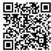
軒銅 VR 校園展覽館