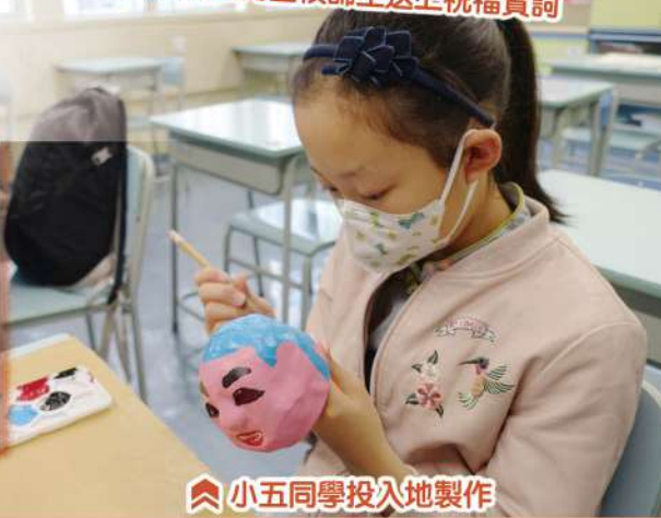
小五同學投入地製作