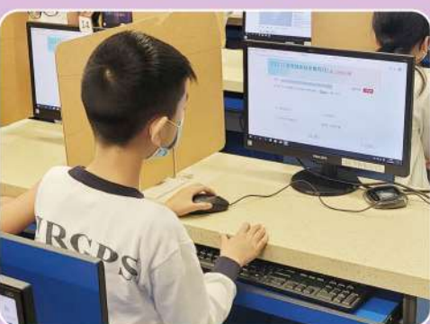
高年級同學正聚精會神地參與網上問答比賽