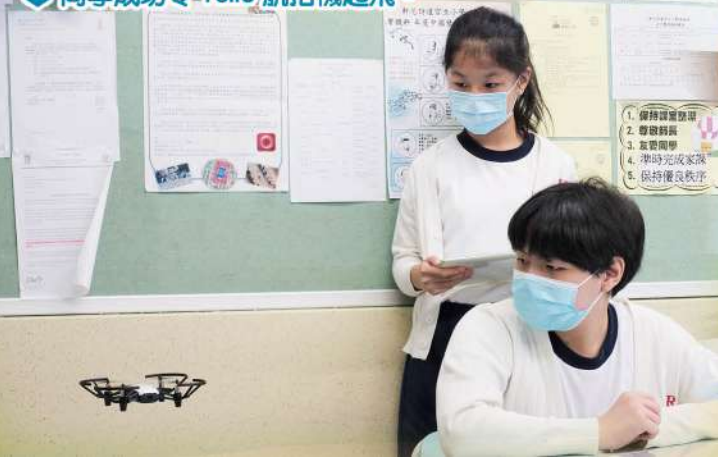
同學成功令 Tello 航拍機起飛。