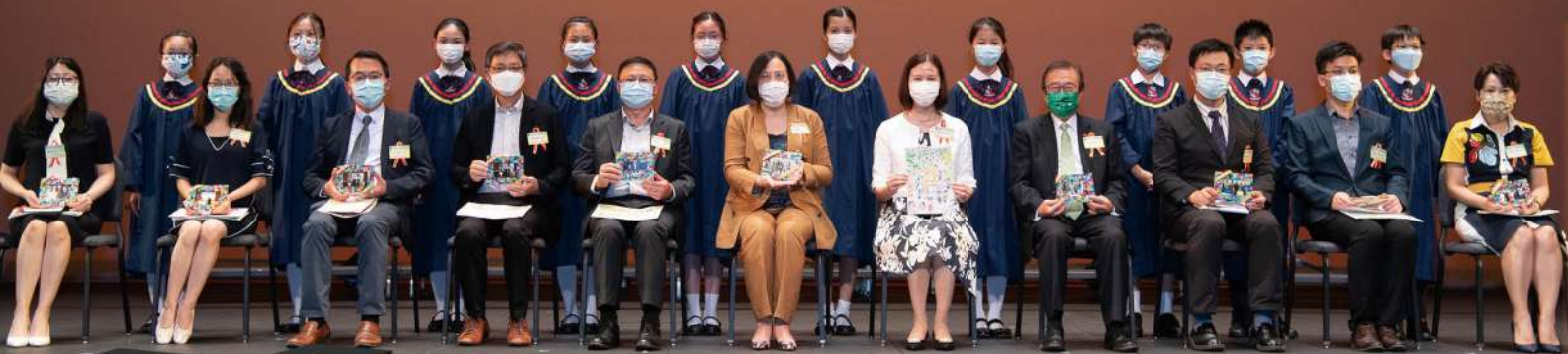
🏠 畢業同學致送紀念品給嘉賓留念