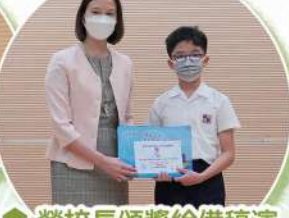
勞校長頒獎給備稿演 講比賽冠軍的同學