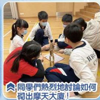
同學們熱烈地討論如何砌出摩天大廈！