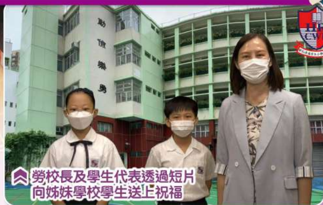
勞校長及學生代表透過短片向姊妹學校學生送上祝福

本年度，本校學生與內地姊妹學校—廣州市越秀區東風東路小學同學以書信作交流，書信主題圍繞「讀書心得」、「在家弄有『營』的一餐」、「過去一年所學到的新知識或技能」及「特別的學習天」。同時，六名五年級學生代表與內地學生首次合作，參加了「2020 粵港姊妹學校中華經典美文誦讀比賽（香港賽區）」，誦材題目是關登瀛的《新的一年帶來新的希望》。很高興，我們於是次比賽榮獲「小學組優異獎（創意）」，兩校同學皆雀躍萬分，盼明年一起參與比賽，再締造不平凡的學習經歷。