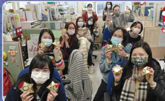
感謝校長的聖誕禮物